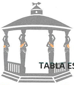
TABLA ESTADÍSTICA DE LA PRIMERA SESIÓN DEL PRESENTE AÑO DE LA COMISIÓN EDILICIA DE ESPECTÁCULOS